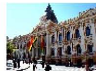
Palacio del Congreso