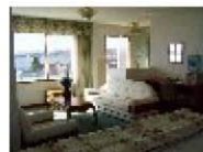
Hotel Las Balsas