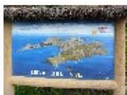
Isla del Sol (2)