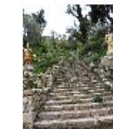
Isla del Sol (7)