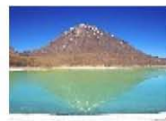
Laguna Verde (2)