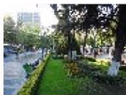
La Paz (2)