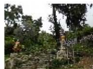
Isla del Sol (3)