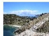
Isla Del Sol (y Luna)